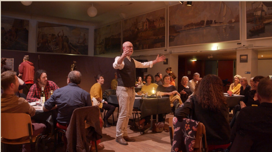
Veillée Douarnenez en chansons - Novembre 2021, photogramme Emglev.